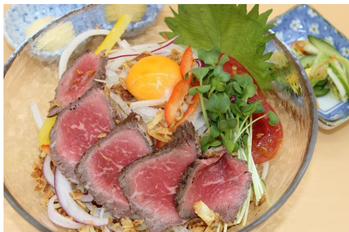
山形 黒毛和牛 冷やし中華