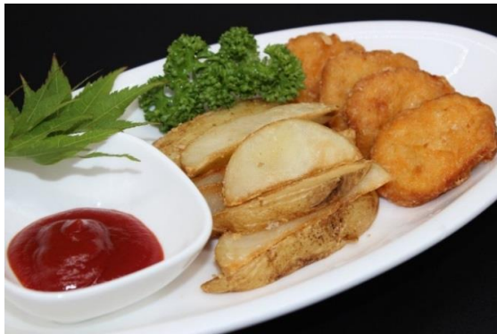
ポテト&ナゲット 700円