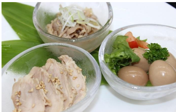
いろ鳥鶏セット 600円