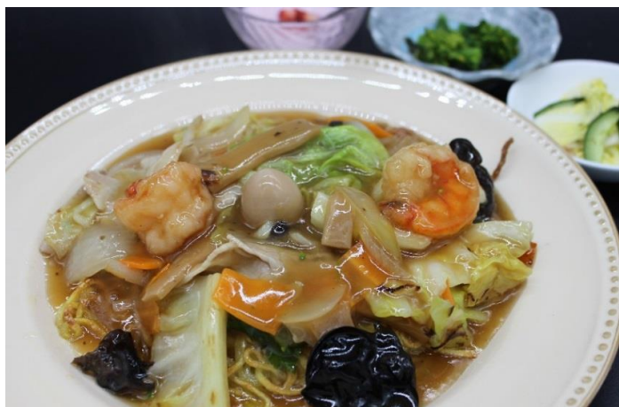
具だくさんの あんかけ焼きそば