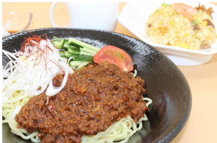
冷たいピリ辛ジャージャー麺と 炒飯セット