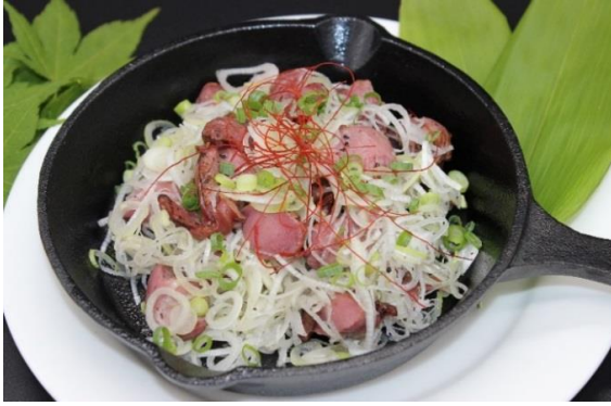
ねぎバカ砂肝焼き 800円