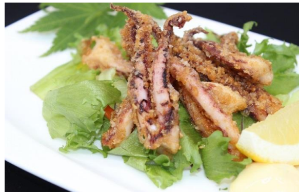
いか下足唐揚げ 600円