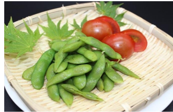
冷やしトマト&枝豆 600円