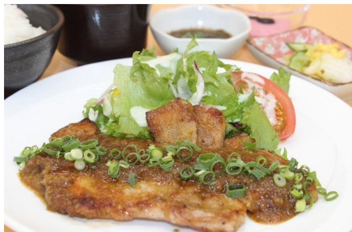
厚切り生姜焼き定食