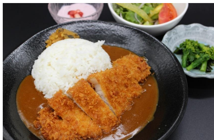
山形県産 豚ロース カツカレー