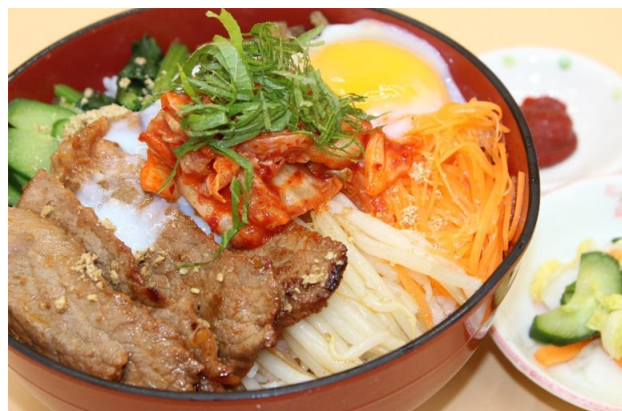
焼肉ビビンバ (牛ロース100g使用)