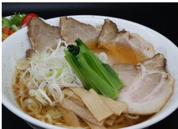
やっぱり定番 チャーシュー麺