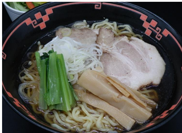
期間限定 冷やしラーメン