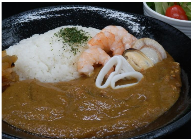
大石田GC 特製 シーフードカレー