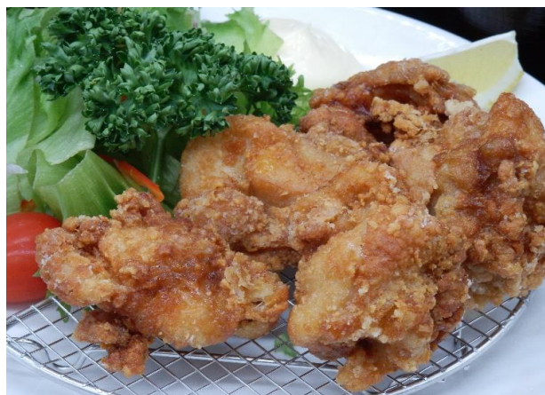
ボリューム抜群 からあげ定食