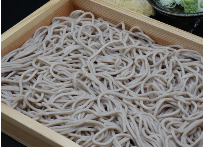
大石田名物 板そば