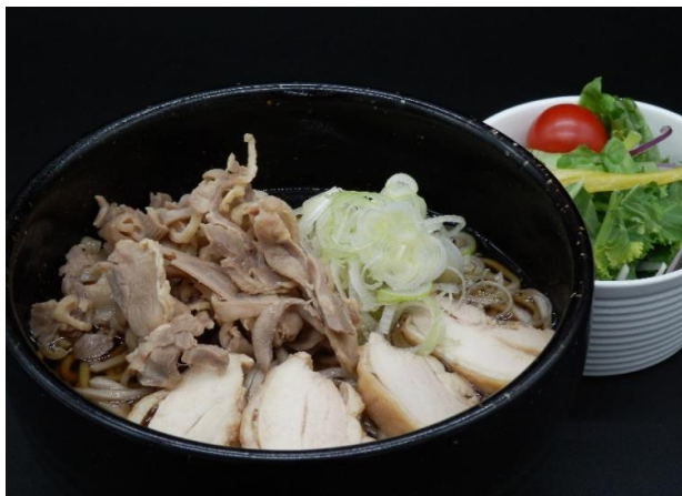
山形名物 肉そば（冷・温）