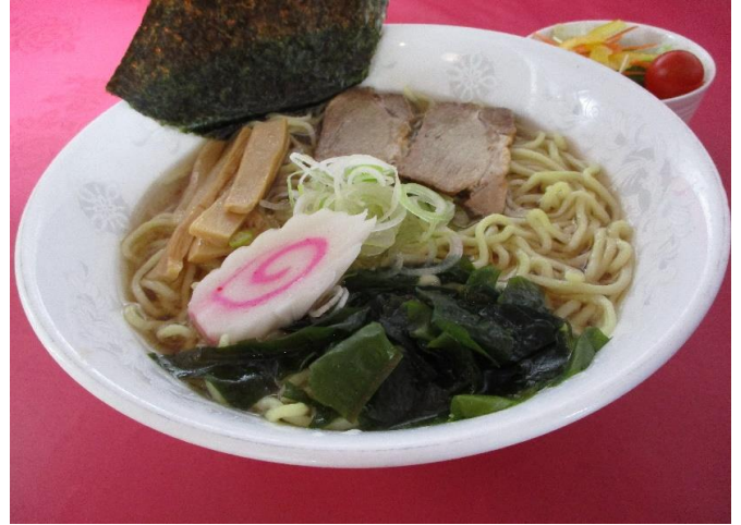
昔ながらの ラーメン