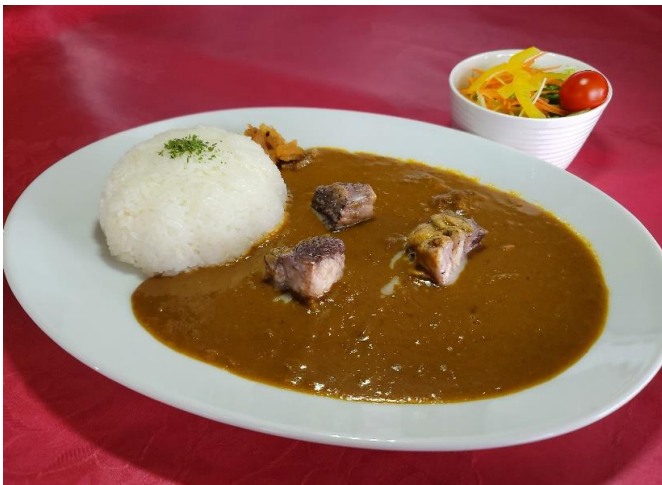
大石田GC 特 ビーフカレー