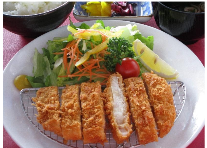
スタミナ満点 とんかつ定食