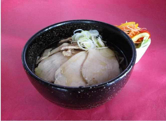
山形名物 鶏そば (冷・温)